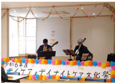
い〜爺〜ずの心地よい 演奏にウツリ♪