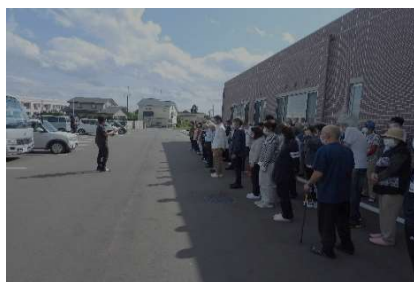
点呼とります！ 皆さん怪我はありませんか？