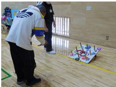
ゲームコーナー① 「輪投げ」

新病院移転後、初めての文化祭を行いました。ゲームコーナーや軽食コーナー、作品展示・販売、抽選会の他に、今年はクラシックギターデュオ「ea-Z's（い〜爺〜ず）」や十和田市内の障がい者就労支援施設（エイサー様・もくもっく様）にご協力いただきました。文化祭後にメンバーに行ったアンケートでは「ゲームが楽しかった」「軽食が美味しかった」等のコメントが寄せられ、大盛況のうちに終わることができました。