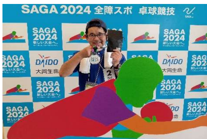
銀メダルおめでとう！！