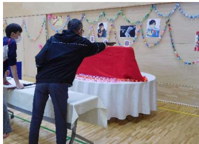
ゲームコーナー② 「射的」