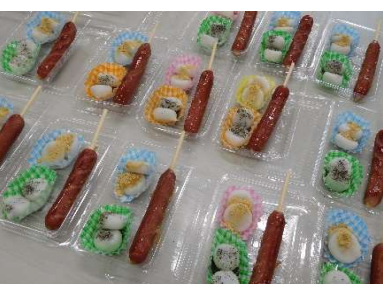
軽食コーナーのお団子と フランクフルト😊