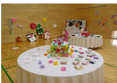
作品展示・販売コーナー 素敵な作品がいっぱい！