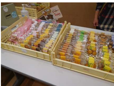
もくもっくのクッキー どれも美味しそう～！