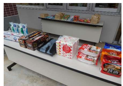
抽選会の豪華景品☆