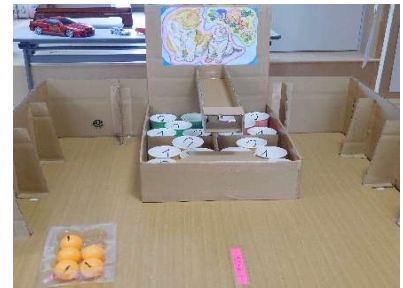
ゲームコーナー③ 「バウンドピンポン」