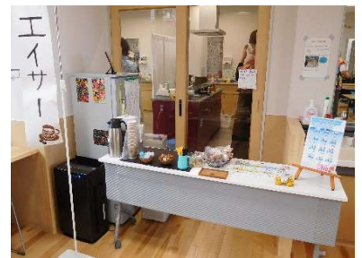
エイサーコーヒー いい香りが漂っています☆