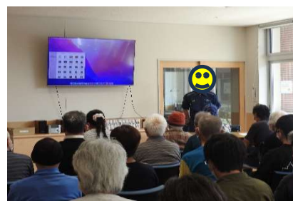
真剣に講話を聴いています